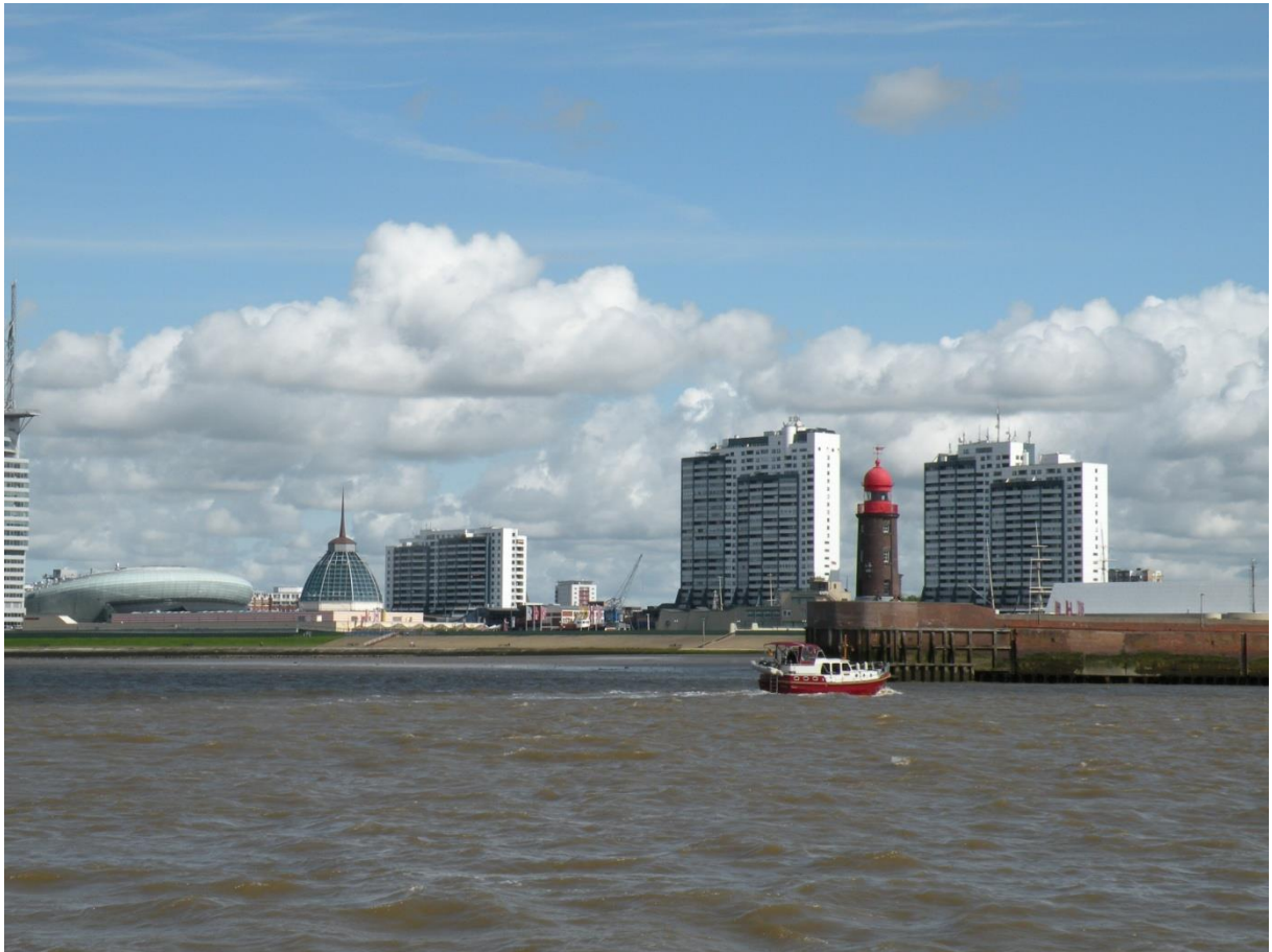
Blick von der Weser auf das Haus links vom Leuchtturm, Schwimmbad in dem 25. Stock